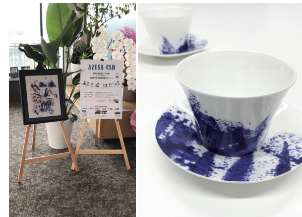
本社受付に展示中の原画とオリジナルカップ

受付には原画も飾っております。子どもたちの既成概念に捉われない、色使いとタッチにもご注目ください!