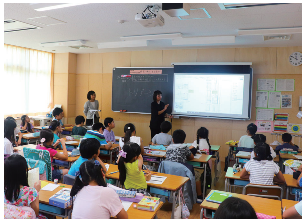
新しい学校を知ってもらう授業の様子

当社が設計した川崎市立小杉小学校では、子どもたちに、新たな学校のことを知ってもらうための様々な授業が行われており、設計者として「木材活用」・「防災計画」というテーマで2回参加させていただきました。難しい内容にも、「木材は燃えるのに、たくさん使って大丈夫なの?」「コンクリートと鉄筋コンクリートとどう違うの?」と、積極的に質問していただきました。