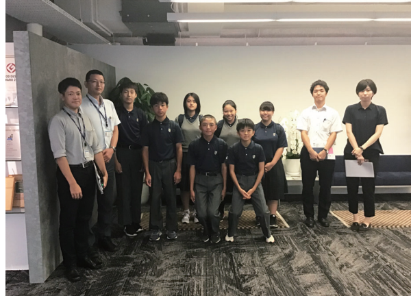
中学生のみなさんから様々な意見をいただきました

未来教育推進機構が主催する「2018年度しながわ職場歩き」に参加、9月10日、品川区立品川学園の生徒さん7名を当社天王洲オフィスへご招待しました。社内の見学、業界や職種の紹介はもちろん、最後にディスカッションも行いました。専門的で難しい内容も含まれたものでしたが、みなさん真剣な眼差しで聞き入り、するどい質問もいただきました！