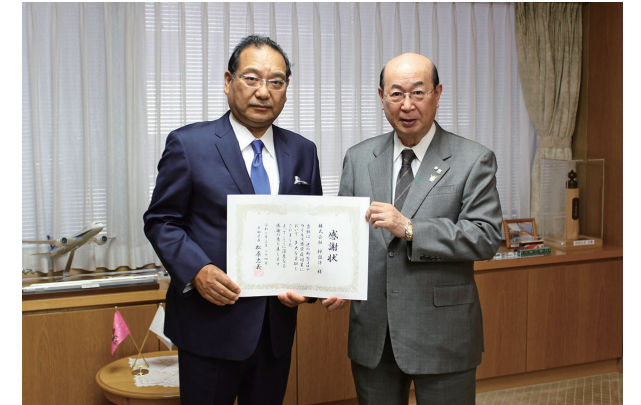
松原忠義大田区長より感謝状を拝受いたしました

2020年3月24日に大田区を訪問し、当社が取引先より提供を受けたマスク 5,000 枚を寄贈。「早速福祉施設で使います」とのことでした。猛威を振るう新型コロナウイルスの早急な鎮静化を心より願っております。