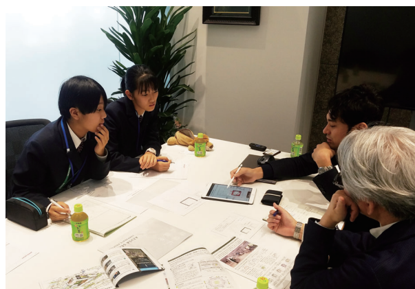
岡山操山中学校の総合学習をサポート