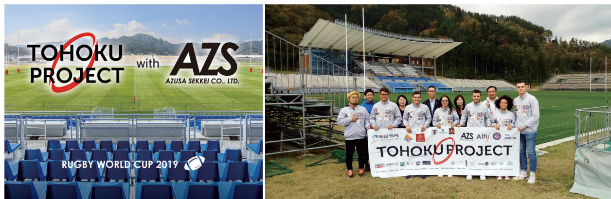
当社設計の釜石鶴住居復興スタジアム見学

主催：日仏交流サポート事務所（宮城県石巻市）／トゥールーズ日仏文化センター（フランス・トゥールーズ）