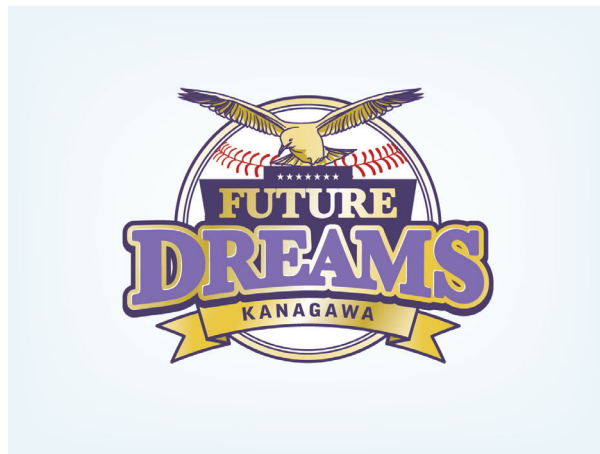
BCリーグの12球団目となる神奈川フューチャードリームス